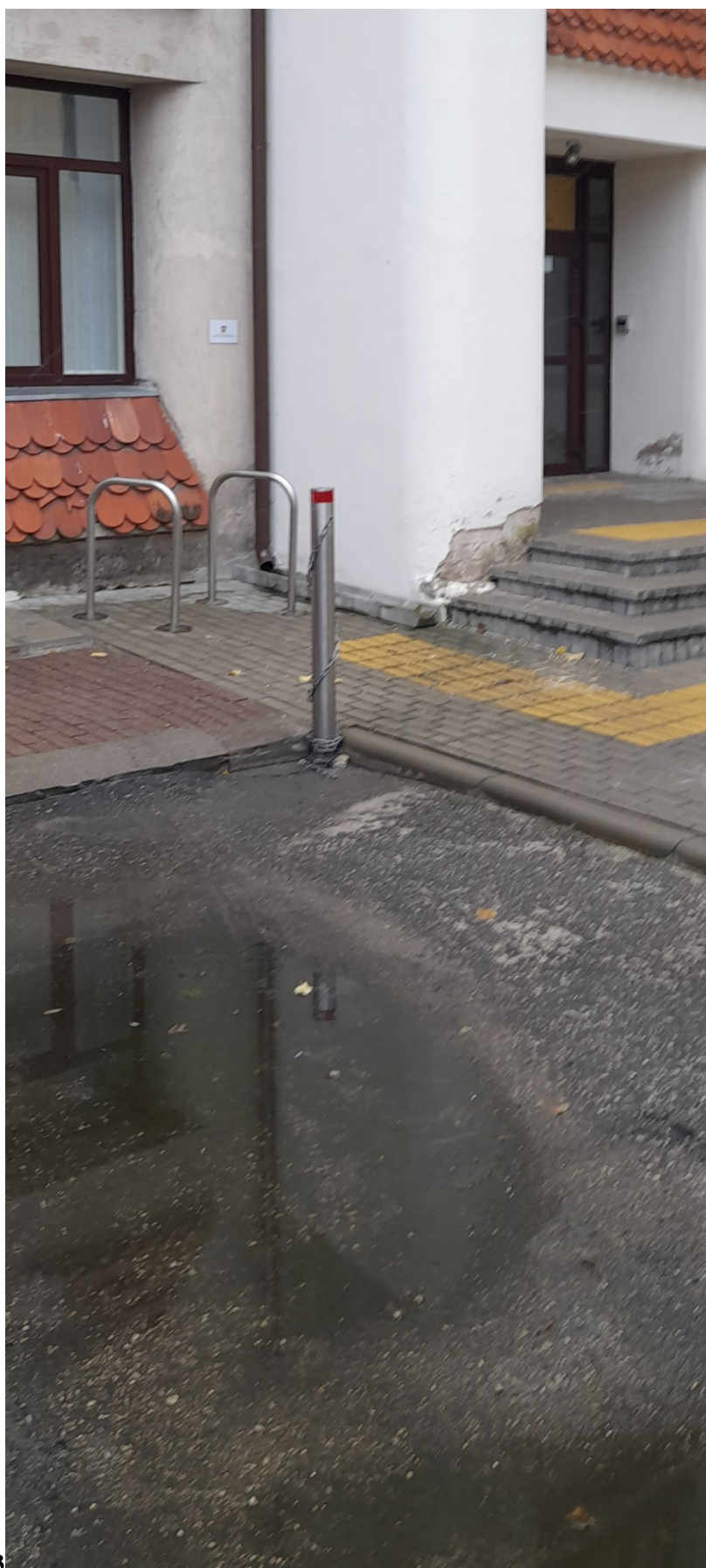
TS priedas Nr. 3