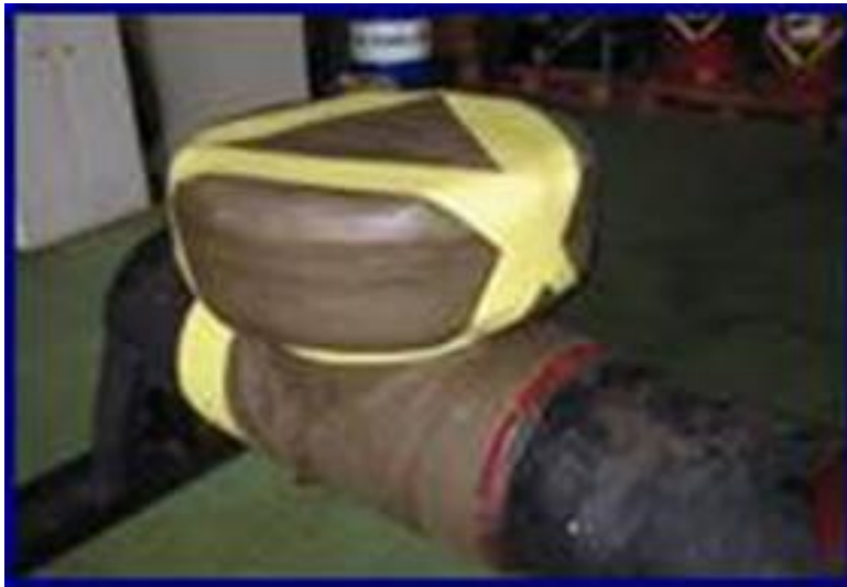
3 pav. Izoliavimas petrolatum medžiagomis.

Aptepti antikorozinė mastika. Gerai padengti varžtų galvutes, veržles bei suvirinimo siūlę. Reikia užpildyti visas ertmes bei suformuoti paviršių taip, kad vyniojant plastinę juostą apie vamzdį nesusidarytų oro tarpų.